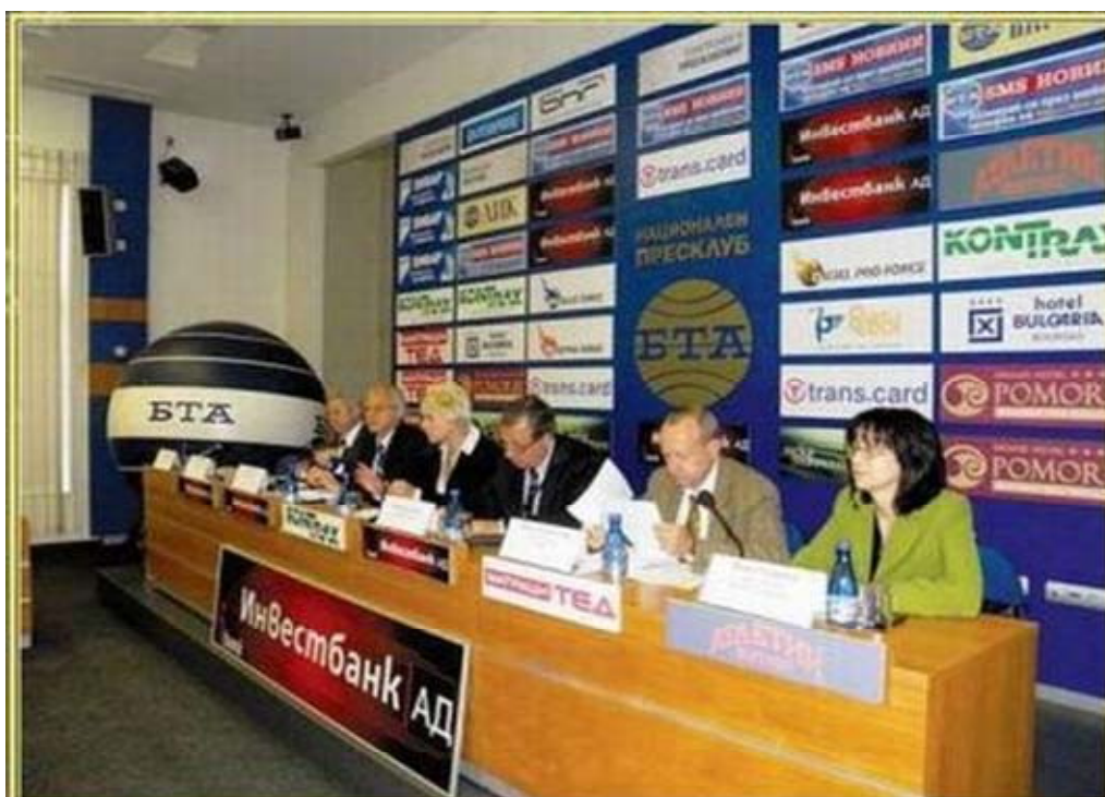
Шестте национално представителни организации на работодателите, сред които и БТПП, представят своите аргументи против национализацията на професионалните пенсионни фондове, октомври 2010