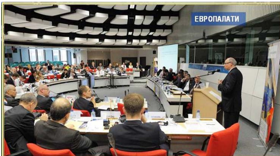
Заседание на Борда на директорите на Европалати - Брюксел, май 2010

Дейността на дирекция "Международно сътрудничество и Международни организации" (МСМО) през 2010 г. се ръководи от следните приоритети :