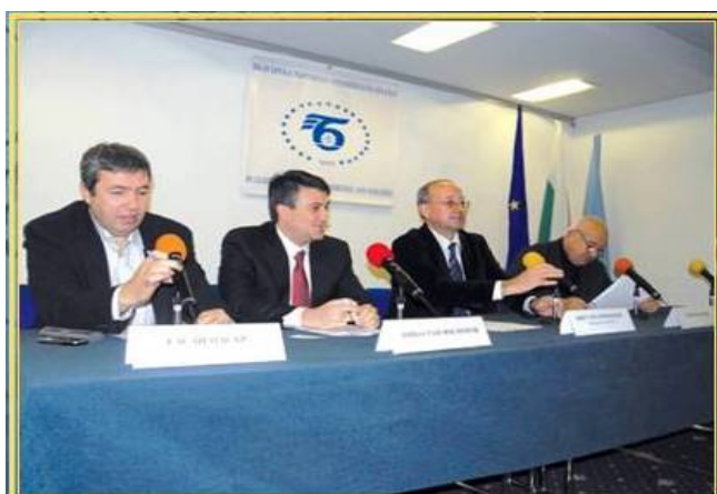
Учредяване на Българо-саудитски съвет към БТПП, ноември 2010