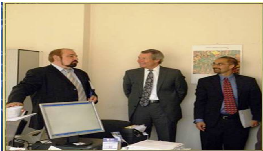
Председателят на Арбитражния съд д-р Силви Чернев представя на поспаника на САЩ – Н.Пр. Джеймс Уорлик новите моменти в дейността на съда, септември 2010