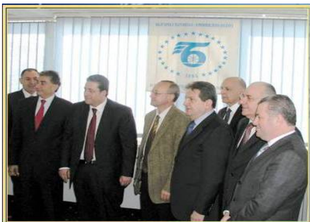
Ливанска бизнес делегация, ръководена от президента на Камарата на Ливан по търговия, промишленост и земеделие, март 2010