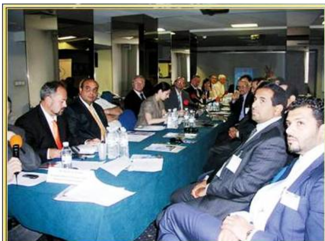
Бизнес делегация от Саудитска Арабия, юни 2010