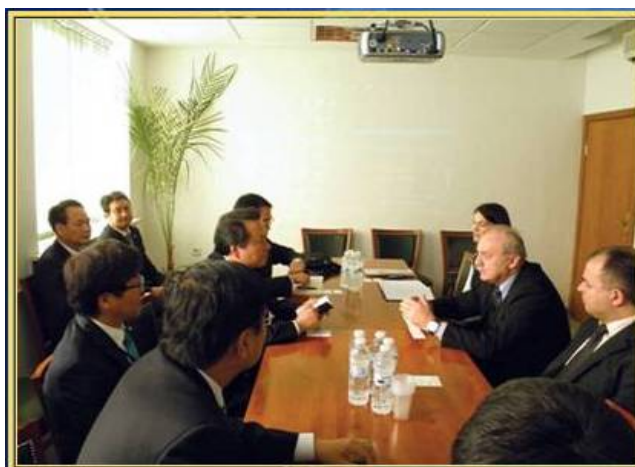
Представители на община Гангсео-гу, гр. Сеул, Южна Корея, ноември 2010