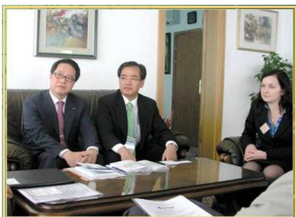
Делегация от Корейската международна търговска асоциация, юни 2010