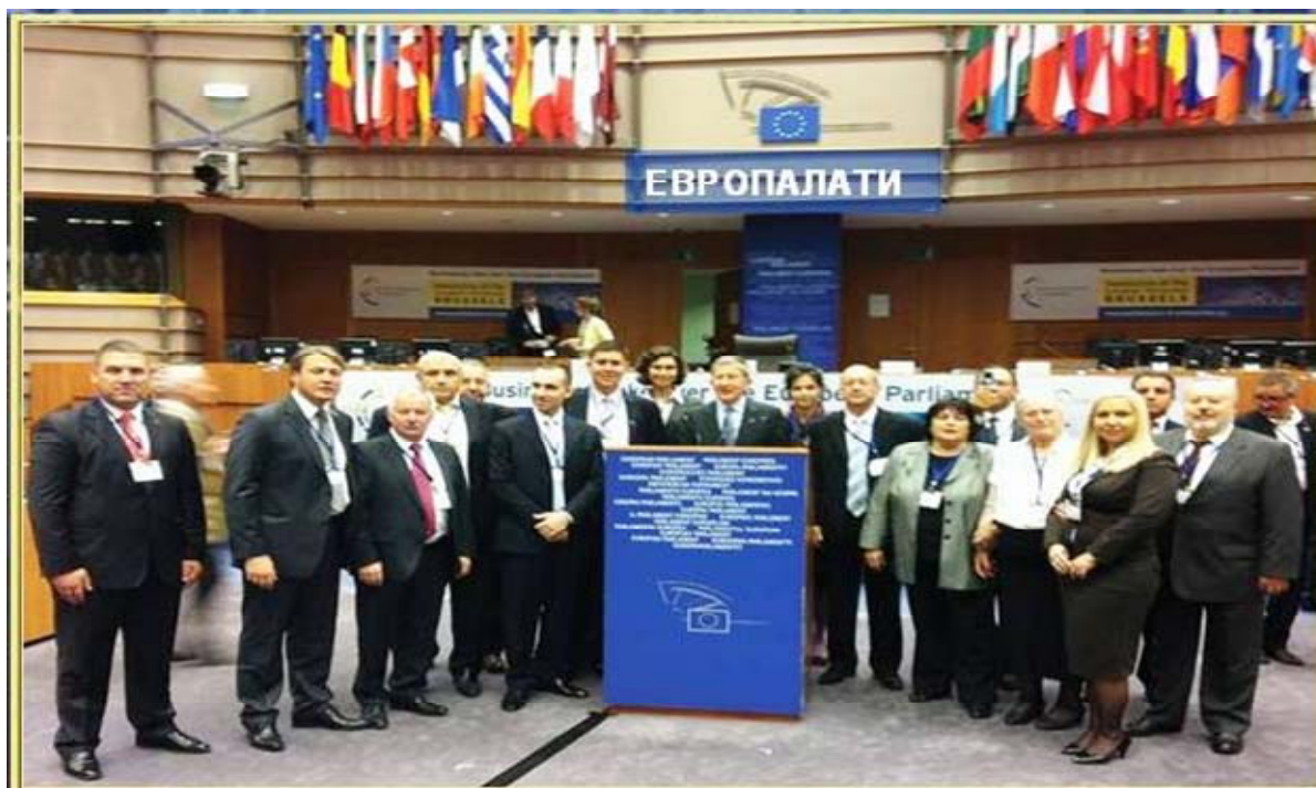
Българската делегация заедно с председателя на ЕВРОПАЛАТИ Алесандро Барберис по време на Втория Европейски парламент на предприятията в Брюксел, октомври 2010