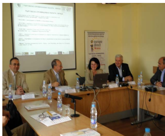
Срещи с бизнеса и местните власти – Враца