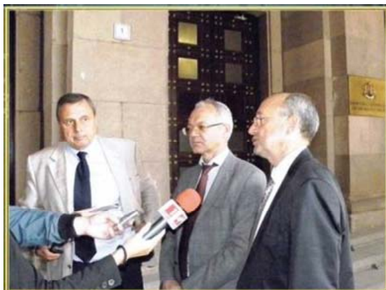
Председателите на трите работодателски организации – БТПП, АИЖБ и БСК, след среща с министър-председателя по реформата в пенсионната система, юли 2010