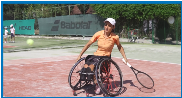
ЗОЯ-УЧАСТНИК В ЕВРОПЕЙСКИ И СВЕТОВНИ ПЪРВЕНСТВА